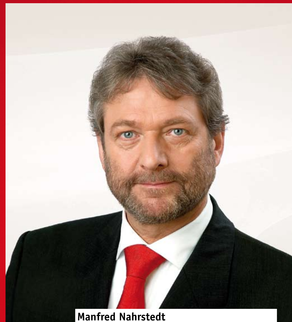
Manfred Nahrstedt Landrat für Stadt und Landkreis Lüneburg

Gutes erhalten, Herausforderungen annehmen, Neues gerecht gestalten!