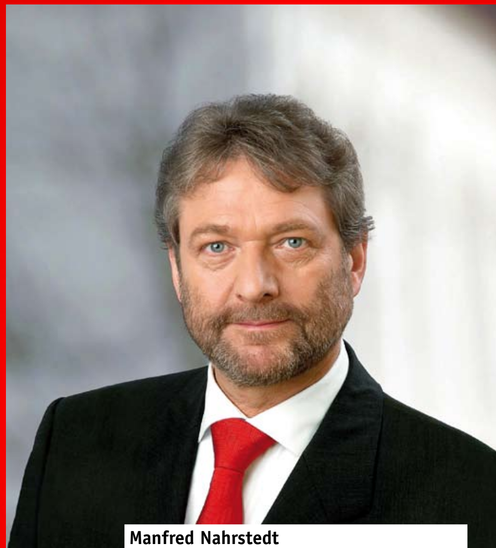
Manfred Nahrstedt Landrat für Stadt und Landkreis Lüneburg

Gutes erhalten, Herausforderungen annehmen, Neues gerecht gestalten!